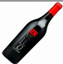
イタリア香り爆発